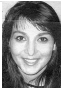
۱-هفت شهر عشق