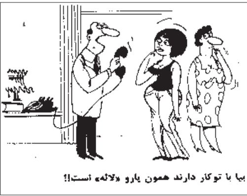
بها یا توکار دارند همون بارو پلانته است!!

اما تا وسط میز غذا نمی رسه! حفظ راز! همشهری ما می گفت: یک راز را سه نفر نگاه می دارند به شرطی که دو نفر آنها مرده باشند! دست و زبان! مادر به دخترش گفت: مگه زبون نداری که دستت رو تا وسط میز غذا دراز می کنی؟ دختر گفت: زبون دارم