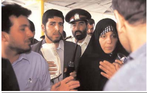
هر موقع این دختر هرزه کثیف شترسوارساندویج خور رو گرفتن ، گفته دارم ساندویج می خورم. این چه ساندویجه که ۲۰ ماهه داره گاز می زنه تموم نشده! اینها از تمام خطاها عبور کردن. به خدا و پیغمبر و امام و حضرت امام و حضرت آقا توهین کردن