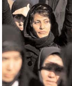
نامه ارسالی از تهران

فروردینگان جشنی است برای یادبود درگذشتگان که همراه با شادی بوده و آیین ویژه ای به همراه دارد و برای زرتشتیان از اهمیت زیادی برخوردار است. فروردین در اوستا فروشنی خوانده می شود و از دو بخش تشکیل شده، فر به معنی جلو و پیش و ریشه و نش به معنی بالیدن است. فروردینگان جشنی است برای یادبود درگذشتگان که همراه با شادی بوده و آیین ویژه ای به همراه دارد و برای زرتشتیان از اهمیت زیادی برخوردار است. فروردین در اوستا فروشنی خوانده می شود و از دو بخش تشکیل شده، فر به معنی جلو و پیش و ریشه و نش به معنی بالیدن است. فروردینگان جشنی است برای یادبود درگذشتگان که همراه با شادی بوده و آیین ویژه ای به همراه دارد و برای زرتشتیان از اهمیت زیادی برخوردار است. فروردین در اوستا فروشنی خوانده می شود و از دو بخش تشکیل شده، فر به معنی جلو و پیش و ریشه و نش به معنی بالیدن است.