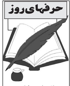
از: عباس پهلوان