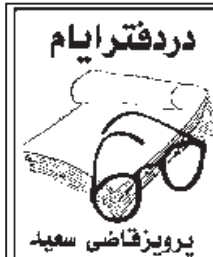
پرویز قاضی سعید

آغاز شد، مخالفان بوش فرصت یافتند تا بگویند ما حتی نیروهای نظامی کماتان برای مواقع اضطراری در شهر نداریم چرا که حتی اعضای گارد ملی شهرهای آمریکا به عراق اعزام شده اند! سرانجام این جورج بوش بود که با کلماتی غم انگیز تقریباً این معنا را به آمریکاییها و جهانیان اعلام کرد که فاجعه کاترینا برنامه دولت را که چهار سال بعد از حادثه یازده سپتامبر آماده جنگ دیگری علیه تروریسم شد، منتفی سازد!