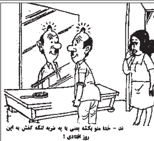
ند - خدا منو بکشه یعنی با په تربه لنگه کش به این روز ابتدای!