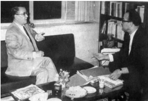
فروغ فرخزاد، سیمین بهبهانی، رهی معیری و بسیار کسان دیگر با هم حرف زدیم و من نظر او را درباره کار، سبک، نحوه بیان و آینده حیات ادبی آنها در تاریخ ادبیات ایران پرسیده ام، و او به همه جوابی در خور و بسزا داده است.

شو منبجر ای دل زمانه- وان آتش خود نرفته میسند ایری بفرست بر سر ری- بار آتش ز بیم و هول و آخند بفکن ز بی این اساسی تخدیر- بگسل ز همه این نژاد و پیوند بر کن ز بن این بنا که یابد- از ریشه بنای ظلم بر کند پس بیهوده نیست که بعد از ملک، اخوان از فرور یختن ارزشهای که بدان باور داشته حرف می زند و ناله مادر را از پشت میله های زندان با این شعر جواب می دهد. اما حالا دوباره فضای روزگار (هزار بار بدتر از دورانی) است که در عصر کمال و بهار و امید بود. به این جهت فکر کردم که یاد از اخوان با این شعر بر از نامیدی و این که "امید و چه نومید" بی فایده ای نیست. و سپس دیدم که یادداشت‌ها کاملا ادبی شده، با خود گفتم چه بهتر، فرصتی است که برای یک هفته هم شده یادداشت‌ها را از سیاست دور نگه دارم.