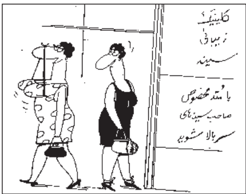
سالم تمام شده! - خوب چند سال دیگه بیست و هشت سالت شروع میشه!؟