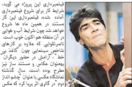
شبهای تهران "تقوایی" ناصر تقوایی کارگردان صاحب سبک و مشهور پیش از انقلاب و پس از آن در سینمای فعلا موجود ایران هم اکنون مشغول آماده کردن شرایط برای برگزاری نمایشگاه عکس هایش با موضوع "شبهای تهران" در پاییز امسال است.

شکار و شنا! اندر اوصاف مایو دو تکه (بیکیینی) یکی از خانم های اهل حال گفته است: این لباس شناپه که بیشتر برای (شکار) مصرف می شود تا