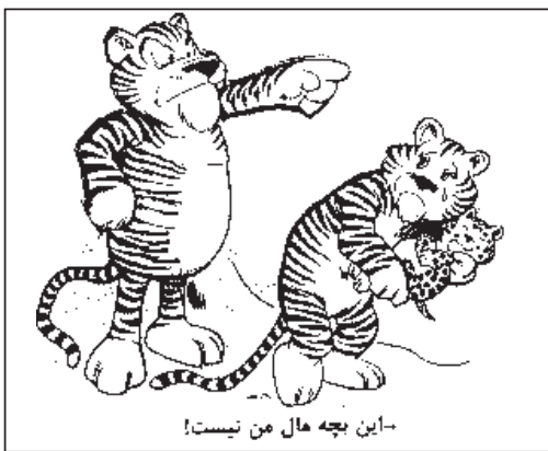
این بچه مال من نیست!

حالیومون نمیشه، آگه بازم، بار به هم میشد و نگاهی به دختر انداخت و گفت: اهلا، سهلا! جوان گفت: آگه منظورت این مفز قلمه که هم اهله و هم سهله! اما نه برای توی چشم در آخوندی از کنار دختر و پسری رد اومده!