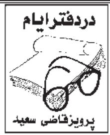
پرویز قاضی سعید

دردفترایام خانم "جویدت یافی" بابت پژوهش های ویژه اش درباره جنگ خلیج فارس در سال ۹۱، موفق به دریافت "مدال شایستگی" از سوی دولت آمریکا شد. او کارشناس ارشد مسائل خاورمیانه و ایران در وزارت دفاع آمریکا است و علاوه بر آن، گویا پست مهمی نیز در سازمان "سیا" دارد، او می گوید: "دیدگاه حمله به ایران و اشغال آن کشور به خاطر تغییر رژیم حاکم بر آن به کلی نامعقول است" و هم او است که بلافاصله اضافه می کند: "با وجود این که آمریکایی ها واقع بین هستند، ولی هر وقت درباره تغییر وضعیت سیاسی در ایران از آن ها سوال می شود، پاسخ های مبهم و گنگ و ناروشن و نامفهوم می دهند. "واشنگتن پست" نشریه معتبر پایتخت آمریکا صراحتاً می نویسد: "قضیه اتنی ایران، ماجراجویی پلوانی است. نه فقط به پایان نرسیده که هنوز و همچنان ادامه خواهد داشت..." و ما می دانیم که در میان کشمکش های اتحادیه اروپا و حکومت اسلامی، آخوندها توانستند یک مهلت نود روزه