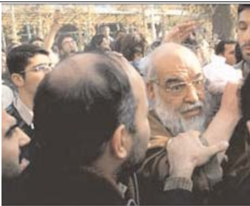
عکس روز: رئیس دانشگاه پس از تک خوردن از دانشجویان

سال هجدهم - شماره ۴۰۴۵ - چهارشنبه ۱۳۸۴ (شهره روزانه ایرانیان خارج از کشور)