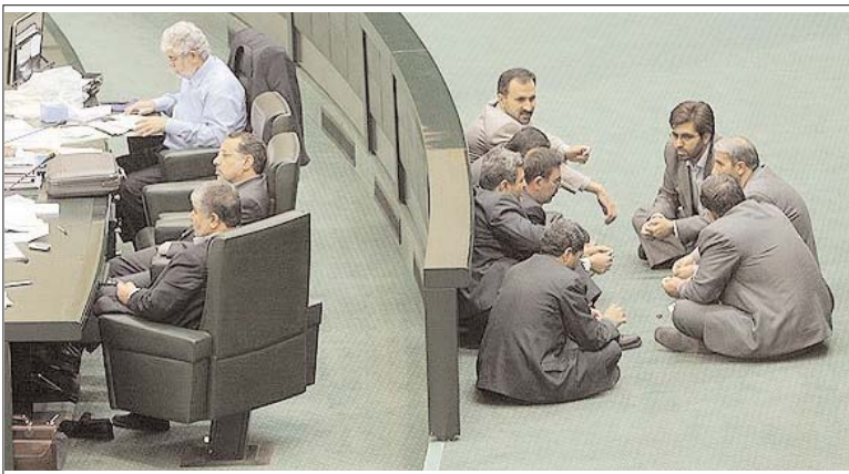
عکس روز: اجلاس پشت پرده در مجلس

به علت تعطیلات روز شکرگزاری عصر امروز تا روز دوشنبه هفتم آذر مطابق با ۲۸ دسامبر منتشر نخواهد شد