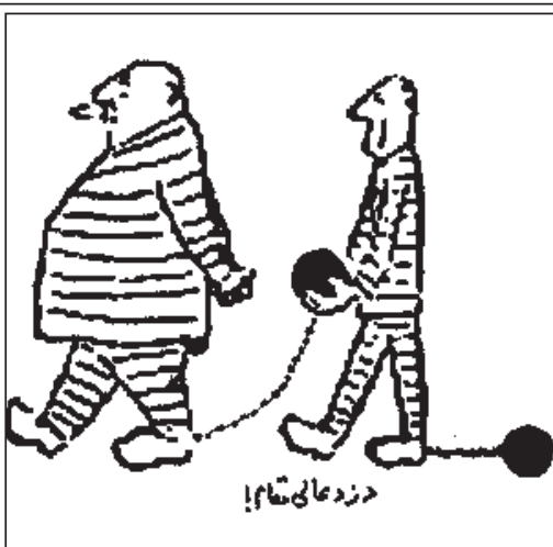
دزد عالی مقام!

یک هالوپشند افتاده بود توی چاه و رفقا صدایش کردند که چطوری؟