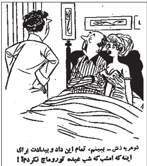
شوهر به دختر - ببینم، تمام این داد و ببندت برای اینه که امشب که شب عیده توروماچ تکر دم!

کلاسهای آمادگی امتحان REAL ESTATE - آیا میخواهید که درآمد اضافی داشته باشید؟ - آیا میدانید که میتونید با حفظ شغل فعلی خود در زمینه وام و REAL ESTATE فعال باشید؟ مدرس: ALI MOORE تلفن: ۶۶-۸۷-۸۸۱۱-۳۴۲ (۸۱۸)