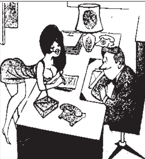
سگر تر جدید... خطم رو پسندیدید، قربان؟ -خیلی... مخصوصاً طرز نوشتن شمارو بیشتر پسندیدم!

کلاسهای آمادگی امتحان REAL ESTATE - آیا میخواهید که درآمد اضافی داشته باشید؟ - آیا میدانید که میتونید با حفظ شغل فعلی خود در زمینه وام و REAL ESTATE فعال باشید؟ مدرس: ALI MOORE 66-87 تلفن: ۸۸۱۱-۳۴۲ (۸۱۸)