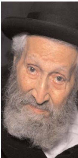
با کمال تاسف خاخم دیدید شوفط، راو بزرگ جامعه ایرانی یهودی که عمری را با نهایت ایمنی و صداقت و

محبت و عشق به همه اقشار و طبقات و همه انسان ها اعم از یهودی یا غیر کلیمی سپری کرده بود، دار فانی را وداع گفت.