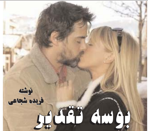
نوشته فریده شجاعی