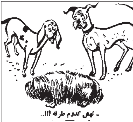
- نهیِ کدوم طرفه !!! -

یک خانم بیوه دم بختی در یک مهمانی، آقایی را پسندید که خیلی سنگین و خوش لباس بود با موهایی فلفل نمکی و طرف او رفت و گفت: آقا عجیبه شما چقدر شبیه شوهر سوم من هستید؟ مرد مودبانه پرسید: ممکنه بپرسم حضرت علیبه تا به حال چند تا شوهر کردید؟ خانم جوابداد: دو تا!