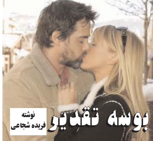
نوشته فریده شجاعی