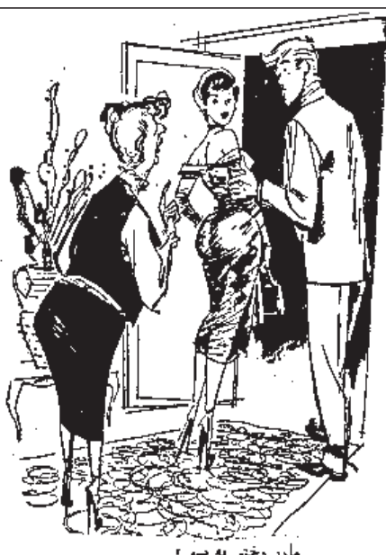
مادر دختی به پسر

پسری به مملی گفت: سببوی اینطوری گاز زن، مواظب گرم اون تو باش! مملی گفت: به من چه. آقا کرمه باید مواظب باشه که من نخورمش!