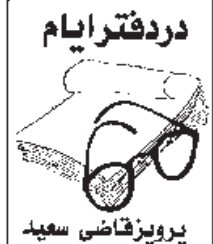
پرویز قاضی سعید

آن چه گفته شد به اختصار بوند فاجعه آمیز کمونیست، مذهبی، آیدئولوژی توده ای و دموکراسی دینی» بود. این را هم از قلم نیندازیم که در توجه به آخوند و قبول خمینی و خامنه ای و رفسنجانی و بهشتی و مطهری - و سایر به اصطلاح روحانیون در مبارزات سیاسی. از سوی مارکسیست ها و مجاهدین خلق بر اثر و القائات علی شریعتی و دیگرانی هم بود که در جوانی به «کشیش مشق آخوندی کرده بود، می توید به او که «جوان! من در از حضرت محمد رسول الله، پل می زدم به حضرت مارکس رهبر خلق الله و حالا تو برای من از مصلحت روزگار، از این که آیه های لاهوتی به فرضیه های ناسوتی نمی خورد، حرف میزنی؟» شب ها هم فیلسوف دیگری به نام «فردید» هم معرکه دیگری در تطبیق آیه های قرآنی با فرضیه های سیاسی، فلسفی و حتی فضاوردی داشت! دهه ۱۳۴۰ را جوانان ما با چنین ملغمه ای شروع کردند. جلال آل احمد در رقابت با علی شریعتی، بیشتر قال چقاق می کرد. حتی جنازه شیخ فضل الله نوری، بر بالای دار را پرچم تسلیم در مقابل تجدد و غرب زدگی نامید. و پا جزوه غلط و غلو و دست و پا شکسته و یک نوع شکلنگ تخته اندازی تاریخی و سیاسی «غرب زدگی» را