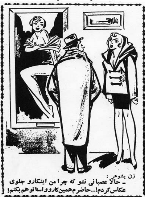
زن بشوهری: حالا عصبانی نشو که چرا من اینکارو جلوی عکاس کردم! حاضر م همین کارو واسه تو هم بکنم!

در یکی از جلسات سخنرانی ماهان این طرف ها وقتی سخنران پشت میکروفن رفت. یکی گفت: در سالن