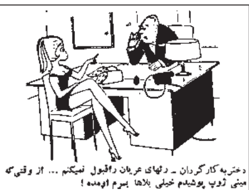
دختر به کارگردان - رهنمای عربیان را قبول نمیکنم ... از وقتی که مینی ژوپ پوشیدم خیلی بلاها برسم اومده!

یکی از زائران برای شقای پایش به حرم مطهر امام رضا رفته بود و مشغول تضرع و زاری بود که دید یکی با زبان خیلی قشنگ و فصیح و لغاتی دلچسب از امام رضا یک پسر طلب می کند. خیلی دلخو شد و با حالت