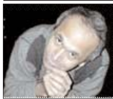
موج گرفتگی آقای ۶۶۶!

آقای ۶۶۶ فعلا دو روز است نطق نکرده، فکر می‌کنم از اینکه تلویزیون‌های جهان نشانش نمی‌دهند حالش خراب است. اصولا سفرهای رئیس جمهور مثل وضعیت موج گرفتگی است. به محض اینکه وارد محیط جدید می‌شود، موج انفجار می‌گیرد و فریاد می‌کند و می‌زند کاسه و بشقاب را می‌شکند و بالش پرت می‌کند و نور می‌بیند و شر به راه می‌اندازد، بعد می‌شنیدند پای تلویزیون و خودش را نگاه می‌کند.