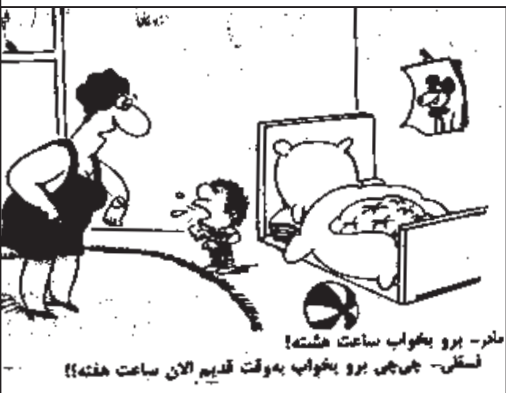
مادر - برو بخواب ساعت هشت! پسر - چه می‌بری بخواب به وقت قدیم الان ساعت هفت!

روم گلزار و از گل‌ها بیرسم / چرا، آن حق جوونه رو گذاشت کف دستش! دختر خیال می‌کرد: عجب پیرزن شیر دلیده، با این که سن زیادی داره ولی باز هم نمی‌ذاره کسی بهش دست درازی کنه! پیرمرده با خودش می‌گفت: این همه به بدبختیه، یکی دیگه حالش رو می‌کنه ولی ما چکنش رو می‌خوریم! پسره با خودش می‌گفت: چه حالی می‌ده آدم کف دست خودش رو بوند. پیرزن با خودش می‌گفت: عجب دختر نجیبیه، خوب