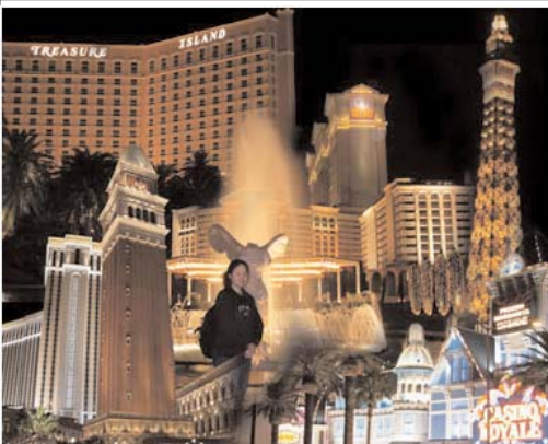
عکس روز: لاس و گاس در فرق ایرانی ها

سال مجدم - شماره ۴۰۶۳ سه شنبه ششم دی ۱۳۸۴ (نشره روزانه ایرانیان خارج از کشور)