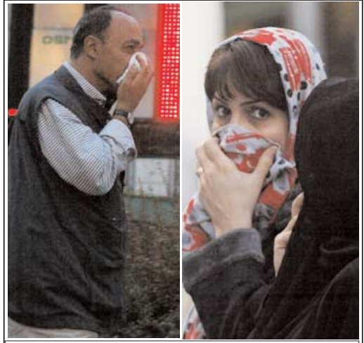
عکس روز: آلودگی هوامدارس تهران را تعطیل کرد

ما دیگر برای فرصت سوزی حوصله نداریم حکومت ایران اعلام کرد محور مذاکرات اتمی عدم انحراف از غنی سازی است