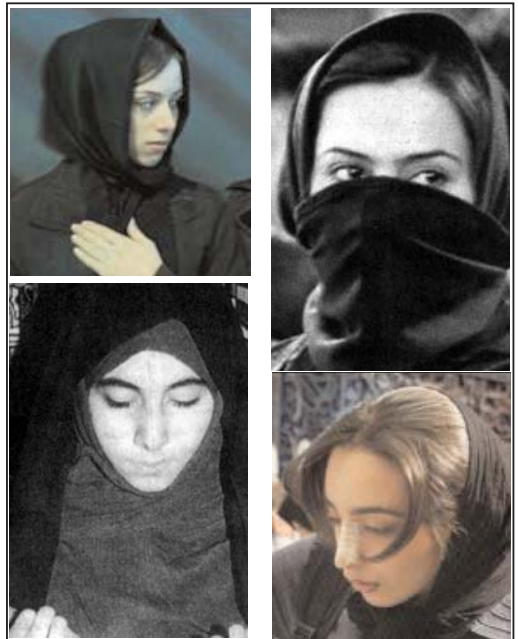
عکس روز: حجاب به سبک دخترهای ایرانی

بسیجی ها به بهانه دفاع از گوی و برزن یک رزمایش برگزار کردند