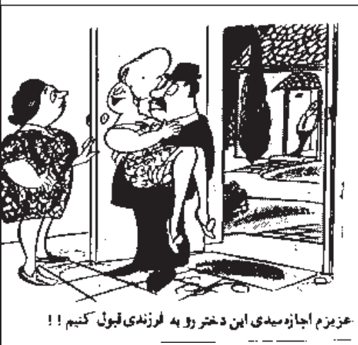
عزیزم اجازه میدی این دختر رو به لرزندی قبول کنیم !!